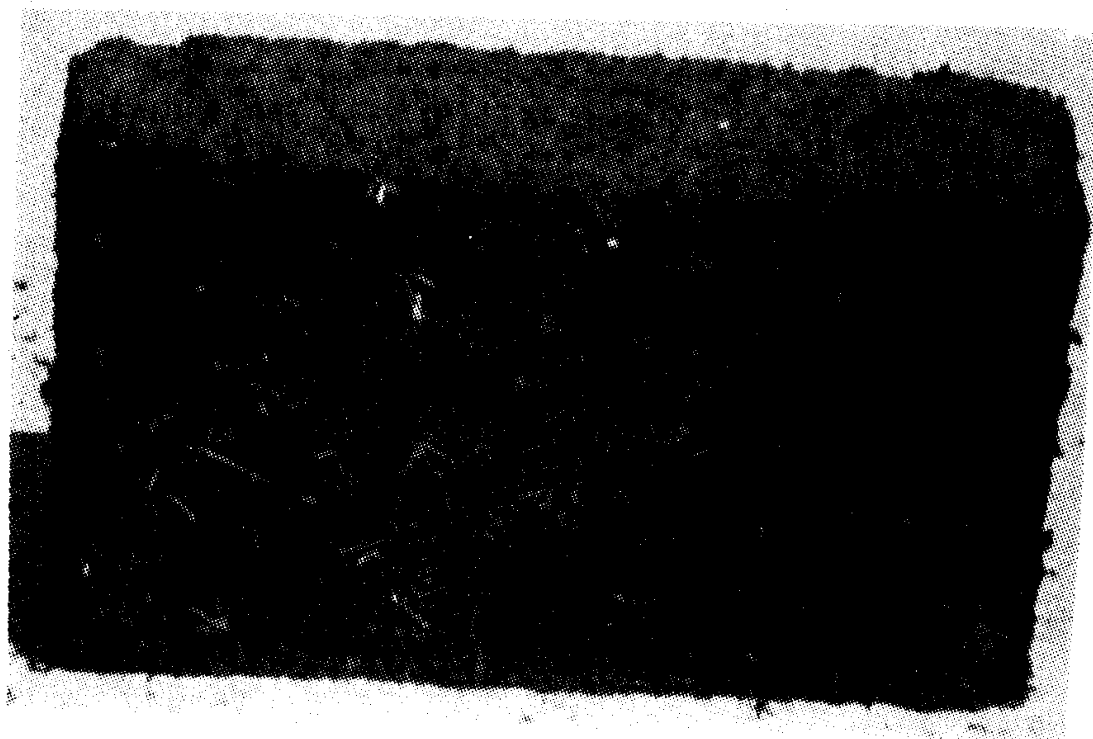
شکل ۶- بلوک حاوی ضایعات چای