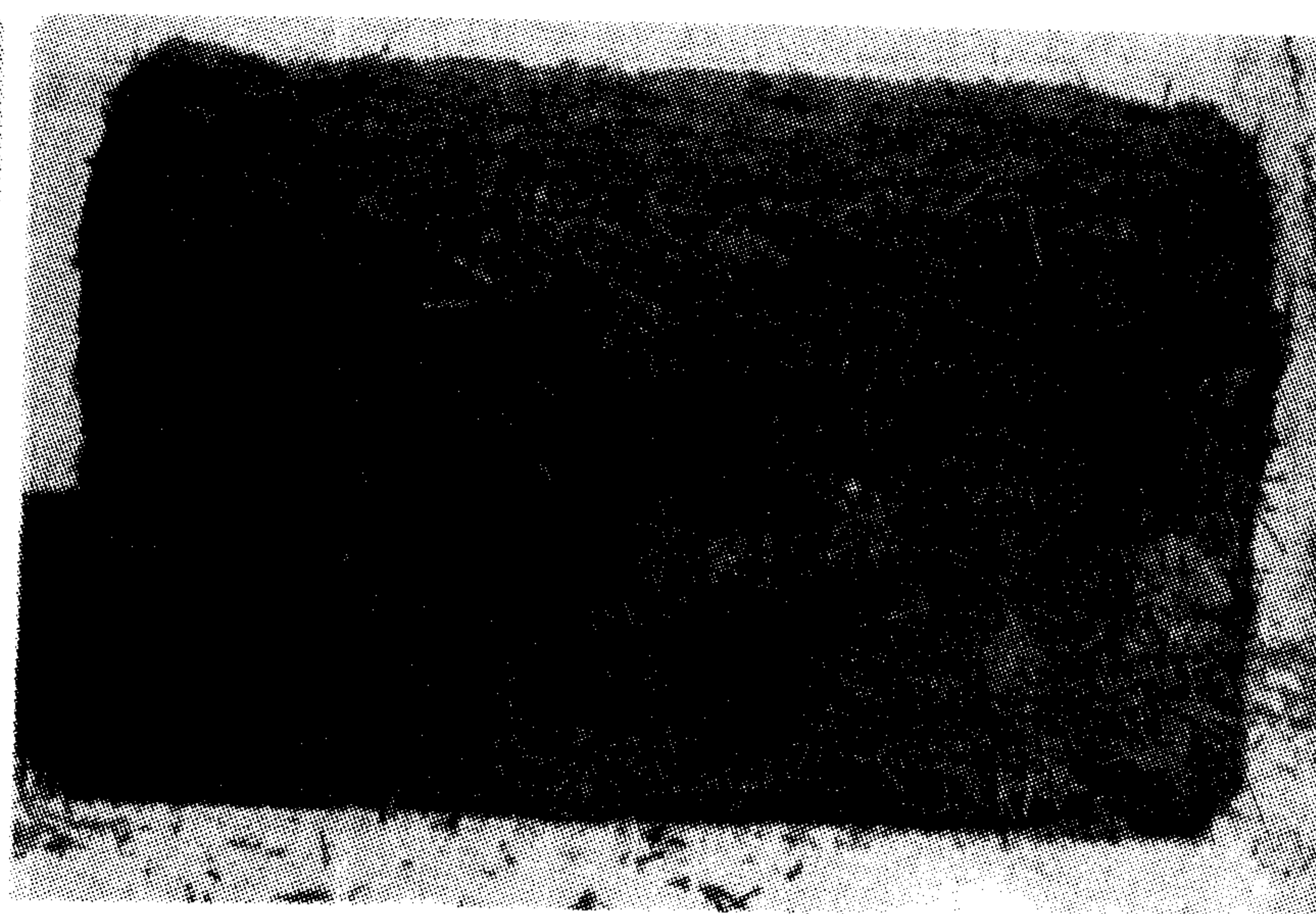
شکل ۵- بلوک حاوی کاه گندم + آهک + ملاس