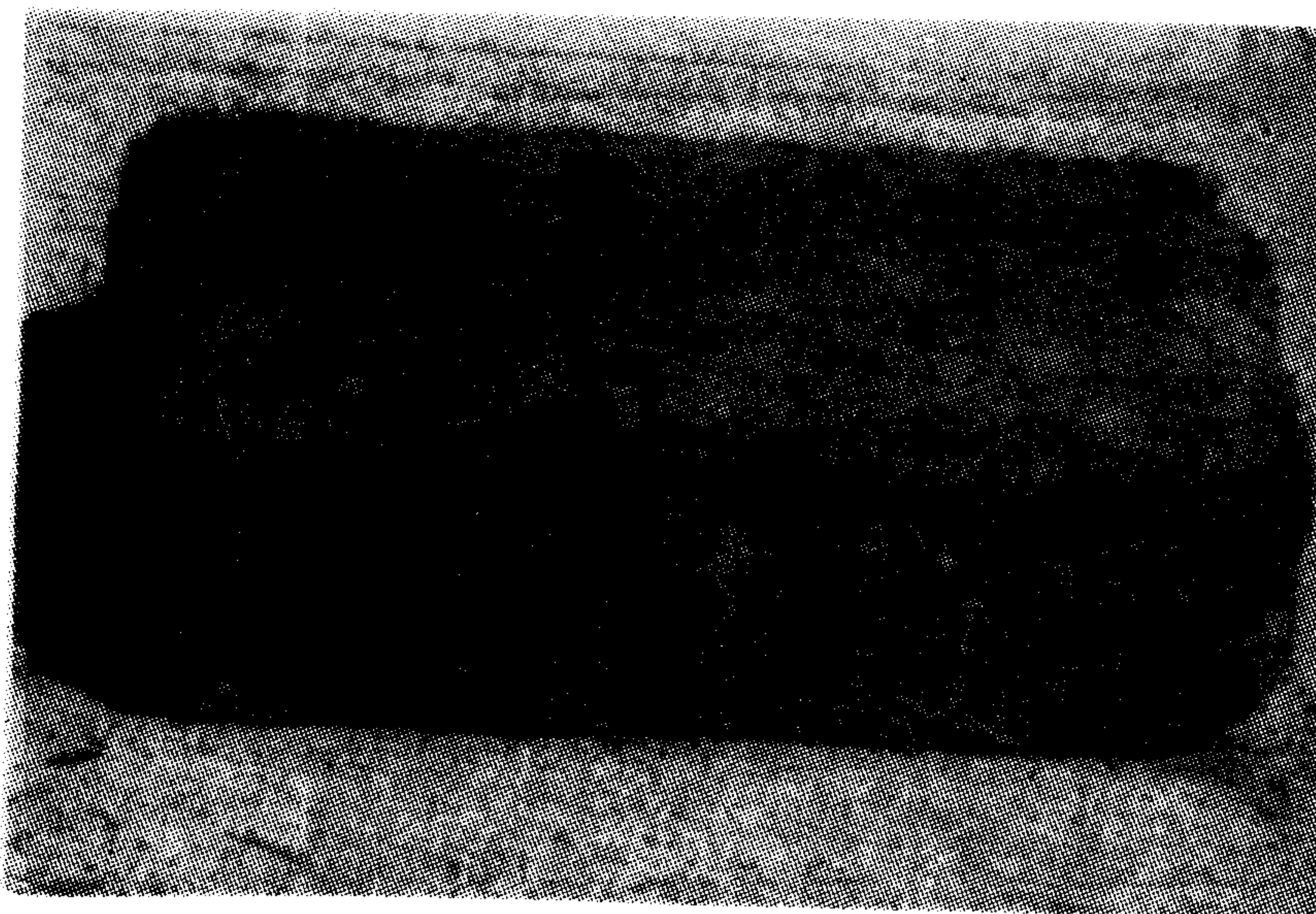
شکل ۳- بلوک حاوی کاه گندم