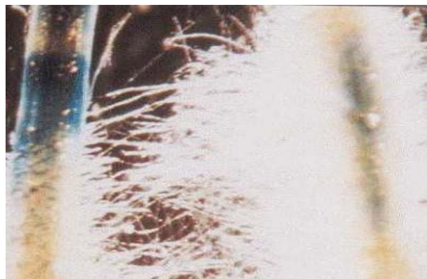
شکل ۹- ریشه‌های موئین تراریخته حامل ژن GUS با پروموتور 35S که بالارو نماتد تلقیح شده و پس از ۱۰ روز رنگ‌آمیزی GUS شده‌اند. لکه‌های آبی در ریشه‌های موئین بیان ژن GUS را نشان می‌دهند.