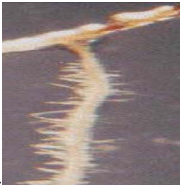
شکل ۱۲- ریشه‌های موئین فاقد ژن GUS تلقیح شده با لارو نماتد که پس از ۱۰ روز رنگ‌آمیزی GUS شده‌اند. رنگ آبی در ریشه‌های موئین دیده نمی‌شود.