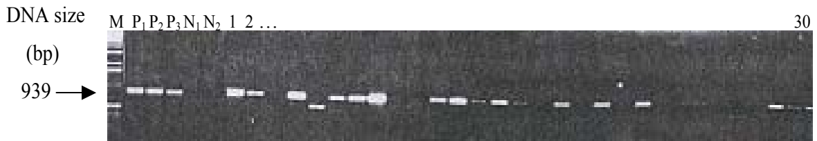
شکل ۵- تشخیص ژن GUS با آغازگرهای اختصاصی در ریشه‌های موئین تراریخته چغندر قند توسط PCR

M- نشانگر مولکولی تعیین اندازه DNA (1KB ladder) P1- محصول PCR برای پلاسمید pAM194 (اولین کنترل مثبت) P2- محصول PCR از پلاسمید pMOG/AT (دومین کنترل مثبت) P3- محصول PCR از DNA ژنومی ریشه موئین تراریخته با pAM194 (سومین کنترل مثبت) N1- محصول PCR از DNA ژنومی ریشه موئین تراریخته با آگروباکتریوم ریزوژنز فاقد پلاسمید دوگانه (اولین کنترل منفی) N2- محصول PCR از Master Mix بدون DNA (دومین کنترل منفی) 1-30- محصولهای PCR از DNA ژنومی ریشه‌های موئین مستقل حاصل از تراریختی با واسطه آگروباکتریوم ریزوژنز حامل پلاسمید pMOG/AT