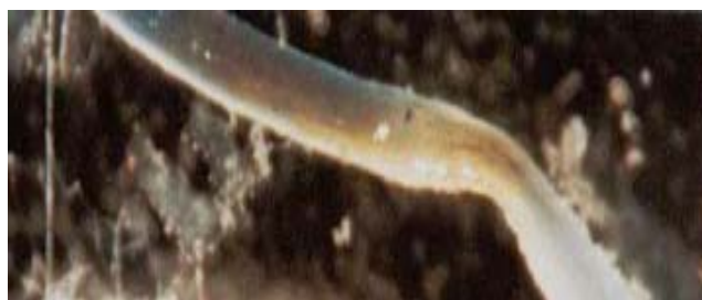
شکل ۱۰- ریشه‌های موئین تراریخته حامل ژن GUS با پروموتور AT حاصل از آرکیدوپسیس تالیانا که با لارو نماتد تلقیح شده و پس از ۱۰ روز رنگ‌آمیزی GUS شده‌اند. لکه‌های آبی در ریشه‌های موئین بیان ژن GUS را نشان می‌دهند.