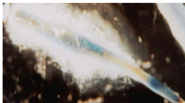
شکل ۱۱- ریشه‌های موئین تراریخته حامل ژن GUS با پروموتور AT آرکیدوپسیس تالیانا بدون تلقیح با نماتد پس از رنگ‌آمیزی GUS (به عنوان شاهد) لکه‌های آبی بیان ژن GUS در ریشه‌های موئین را نشان می‌دهد.

آلودگی به نماتد، بیان این ژن افزایش می‌یابد. این امر نشان دهنده اثر متقابل پروموتور HsI^{pro-1} و نماتد است. در حالی که نتایج تحقیق ما نشان داد که توالی پروموتوری AT جداسازی شده از آرکیدوپسیس تالیانا، پس از تراریختی به گیاه چغندر قند و آلوده سازی ریشه با لارو نماتد نتوانست بیان القایی ژن را تایید نماید. به طوری که در تمام قسمت های ریشه پس از رنگ آمیزی GUS، لکه های آبی رنگ مشاهده گردید. این امر نشان می دهد که توالی های خاصی از پروموتور HsI^{pro-1} باعث القایی شدن بیان ژن مجاور آنها می گردد. بنابراین پروموتور AT جداسازی شده از آرکیدوپسیس تالیانا علی‌رغم شباهت زیاد با توالی پروموتور القایی ژن HsI^{pro-1} چغندر حالت القایی نداشته بلکه بیان مداوم یا ذاتی ۱ داشته و مانند پروموتور CaMV35S عمل می‌نماید.