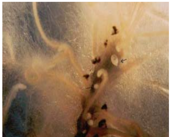
شکل ۷- سیست‌های نماتد تشکیل شده بر روی ریشه‌های موئین ۱۰