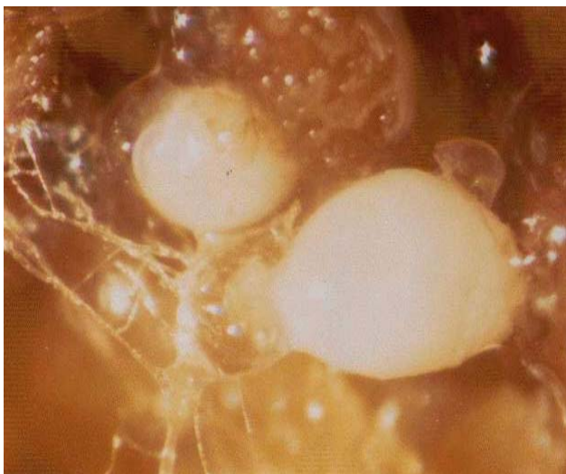
شکل ۸- دو سیست نماتد از شکل ۷ با بزرگ‌نمایی بیشتر

رقم ۹۳۱۶۱p چغندر قند با آگروباکتریوم ریزوژنز حامل پلاسمید pMOG/AT M- نشانگر مولکولی تعیین اندازه DNA (1KB ladder) P- DNA ژنومی ریشه موئین تراریخته چغندر قند واجد ژن GUS (کنترل مثبت) N- DNA ژنومی ریشه موئین تراریخته چغندر قند فاقد ژن GUS (کنترل منفی) 1-18- DNA ژنومی ریشه‌های موئین تراریخته چغندر قند که نتایج PCR آنها مثبت بوده است. ۵۰ درصد از ریشه‌های موئین بیش از یک نسخه T-DNA دریافت کرده‌اند.