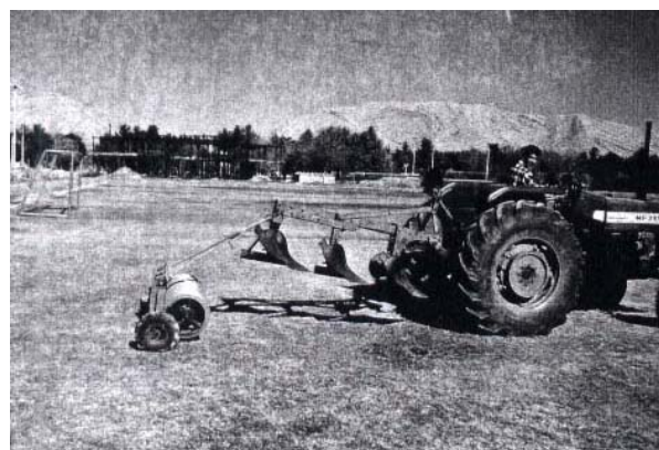
شکل ۲- غلتک خاک نشان در حالت راهپیمایی

حامل از زمین فاصله گرفته و مجموعه غلتک‌ها به دنبال گاوآهن کار کلوخ شکنی و تثبیت خاک شخم خورده را آغاز می‌نمایند. غلتک خاک شکن به فاصله حدود یک متر در پشت گاوآهن و همراستا با آن حرکت می‌نماید تا از اعمال نیروی جانبی یا خارج از محور به دستگاه گاوآهن جلوگیری شده و کلوخه‌های حاصل از شخم بلافاصله قبل از دست دادن رطوبت توسط دیسک‌های غلتک خرد گردند.